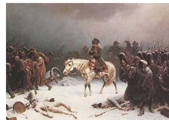
Отстъплението при Москва, 1812, худ. Нортем