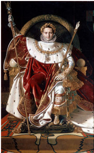
Наполеон като император, худ. Енгър, 1806