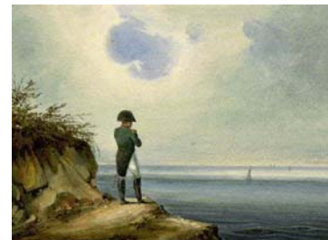
Наполеон на Св. Елена, худ. Сандман

След поражението при Ватерлоо , Наполеон губи войната срещу коалицията и се предава в плен на англичаните, които го заточват на о-в Св. Елена в Атлантическия океан (1815-1821).