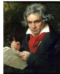
Бетовен, худ. Щилер, 1820

5-а Симфония на Бетовен. Композитора я посвещава първоначално на Наполеон Бонапарт, но след като разбира, че последният се е провъзгласил за император, променя посвещението си "на героя".