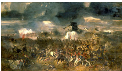
Битката при Ватерлоо 1815, худ. Андрийо, 1852

1804 Наполеоновият кодекс. Провъзгласяване на Империята.