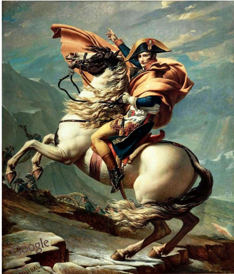
Наполеон преминава Алпите, Jacques-Louis David, 1801