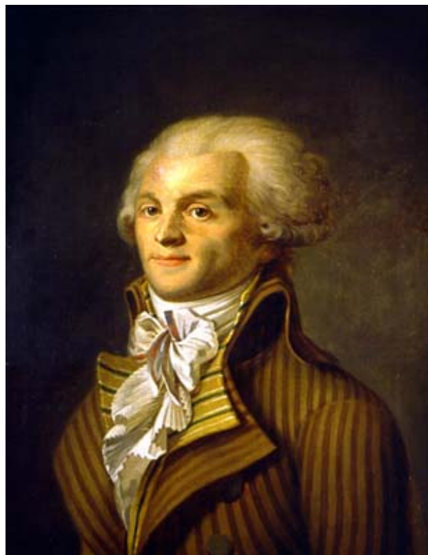
Робеспьер. Анонимен, 1790