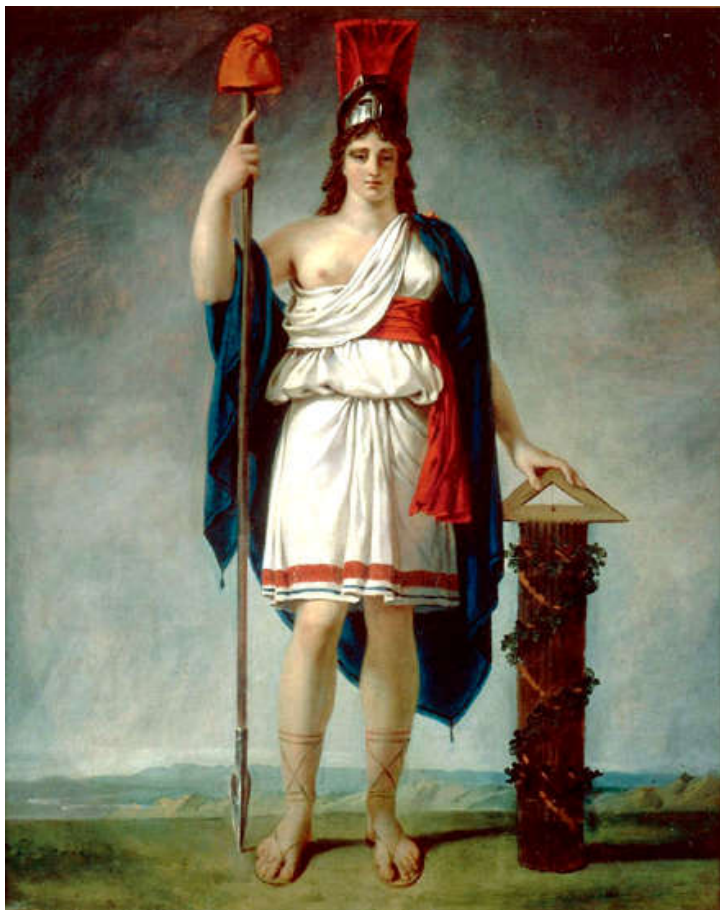
Алегория на Републиката, Antoine-Jean Gros (1771-1835)