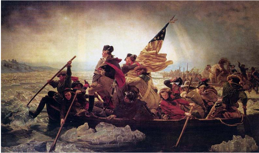
Е. Лойце. Дж. Вашингтон преминава Делауер, 1851