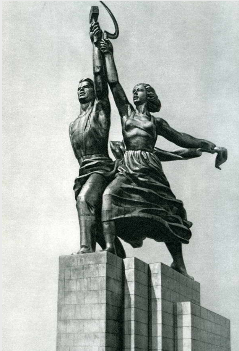
В. Мухина, 1938