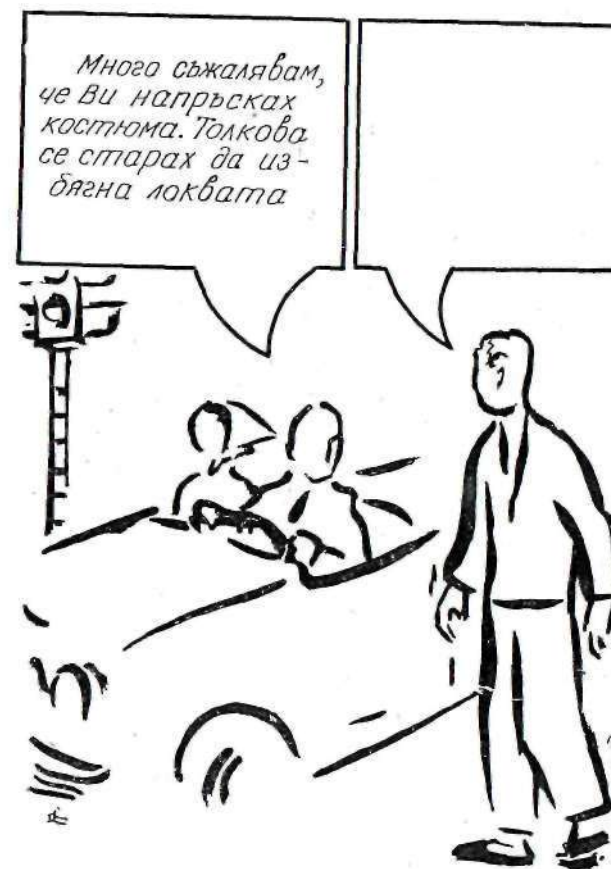
Картина от теста на Розенцвайг (1)

В категорията на проективните тестове трябва да се отбележи и друг широко използван метод — картините на Розенцвайг.