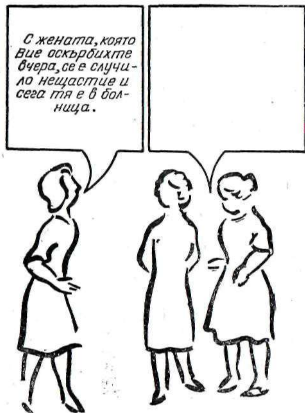
Картина от теста на Розенцвайг (21)

Тестът се състои от 24 шрихови рисунки на различни положения на затруднения, създадени от някого или някое непреодолимо препятствие. Рисунките са такива, че в общото очертание на лицата и фигурите на хората не се изразява определено отношение или настроение, тъй като това