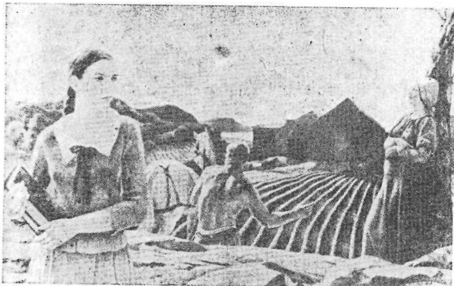
Картина от Т А Т (а)

зени чрез човешки фигури, поставени в различни взаимоотношения и сложни ситуации. Картините са подбрани така, че да дават възможност за разнообразни описания и тълкувания. Картоните с картините се използват в различни комбинации, зависещи от възрастта и пола на из-