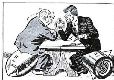
"D'accord Monsieur le Président, nous voulons négocier"