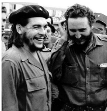
Че Гевара и Фидел Кастро