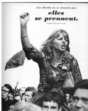
Плакат от май 1968, Париж