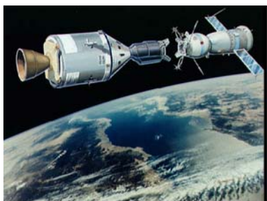
Скачването на „Аполо“ и „Союз“