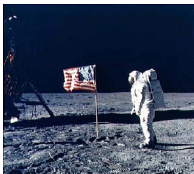
Н. Армстронг на Луната