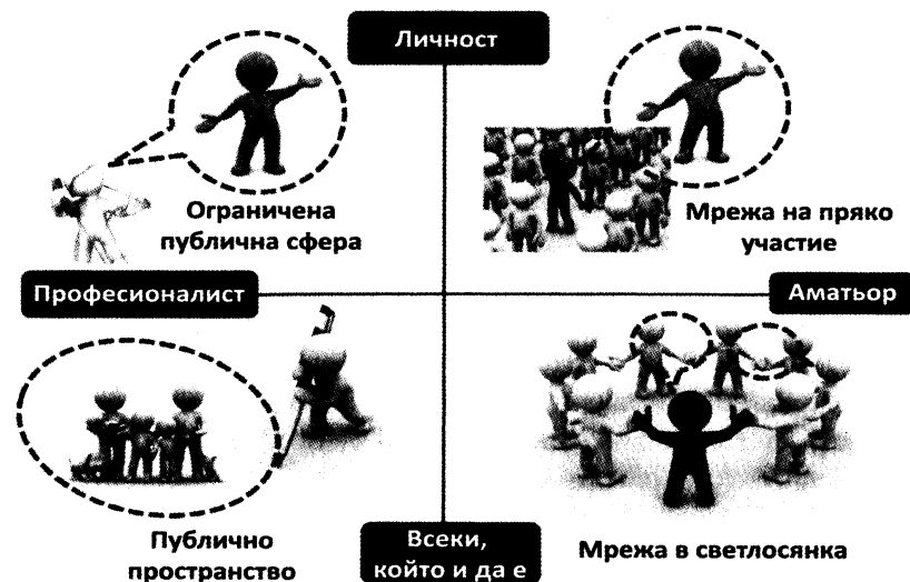
Фиг. 1. Четири форми на публично говорене

Тази схема позволява да се покаже конфликтът между двата принципа, благодарение на които могат да се уреждат споровете по отношение на това, кой има право да взема думата в публичното пространство. Този, който говори, трябва да има закрилата на правото за свободно изразяване; онзи, за когото се говори, има правото на закрила на частния си живот. Както често е било подчертавано, няма смисъл от усилието да се откъсва самостоятелно правото на privacy 45 . То придобива пълния си смисъл само като ограничаване при упражняването на други права (и по-специално свободата на изразяване). Следователно, възможно е да се изследва начинът, по който четирите типа взимане на думата биват регулирани. Първите две фигури (отляво във Фигура 1) представляват стълбовете на традиционното публично пространство, такова, каквото се е появило заедно с масмедиаите.